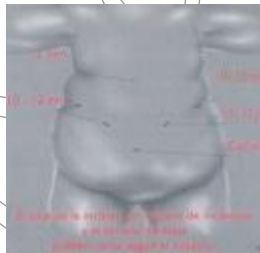
Ilustración 10: Incisión de la Cirugía Bariátrica por Técnica Abierta