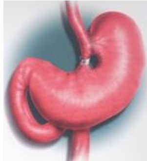
Ilustración Procedimiento Restrictivo

2 - Procedimientos Malabsortivos que combinan mecanismos restrictivos y malabsortivos dentro de las cirugías para la pérdida de peso.